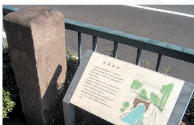
⑧ 駄倉橋跡 Map 狛江駅周辺図

六郷用水に架かっていた橋で、石とレンガを使ってアーチ形に作られていました。橋の形から「めがね橋」とも呼ばれました。