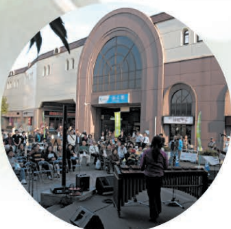
⑩ 狛江駅北口 Map 狛江駅周辺図