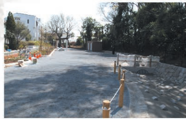
② 清水川公園 Map D-5