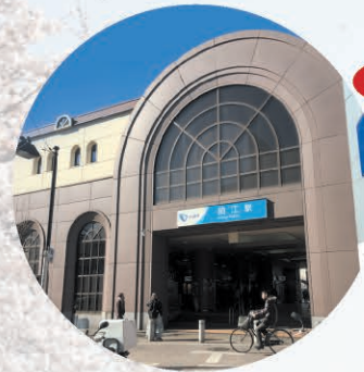
① 狛江駅南口 Map 狛江駅周辺図