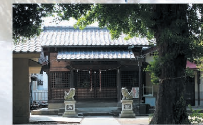
④ 日枝神社 Map E-6

かつては山王権現と称する小さな祠でした。日枝神社の参道には、イチョウやケヤキの木が並び、秋には奇麗に色づきます。