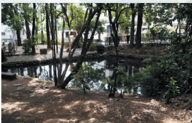
⑨ 弁財天池 Map 狛江駅周辺図

良井僧正が雨乞いをおこなったところ、竜蛇があらわれて雨を降らし、その時に湧き出したのが弁財天池だという伝説があります。