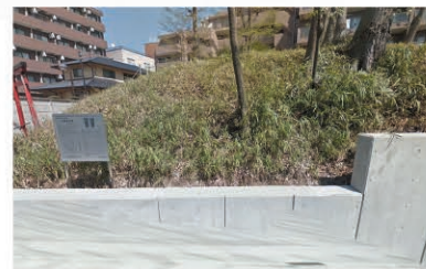
⑥ 土屋塚古墳 Map E-5

5世紀中頃に築造された円墳で、周溝から大量の円筒埴輪が出土しました。その一部を市役所2階のショーケースに展示しています。