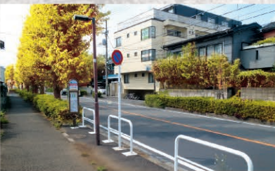
⑦ いちよう通り Map D-5

狛江通りから世田谷通りまでを繋ぐいちよう通りは、約50本のイチョウが飾る約620mの市道。市の木にも制定されているイチョウには、秋になると鮮やかな黄色の葉が生い茂り、道行く人々を楽しませてくれます。