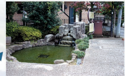
③ 岩戸川せせらぎ Map E-6